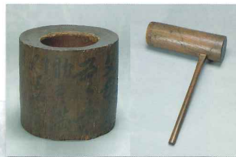
福澤諭吉使用 白と杵 (慶應義塾福澤研究センター)