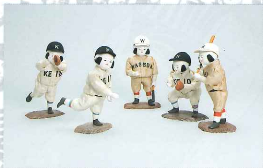
昭和初期の 早慶野球戦日本人形 (慶應義塾福澤研究センター)